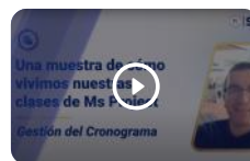
Ms Project - Gestión del Cronograma